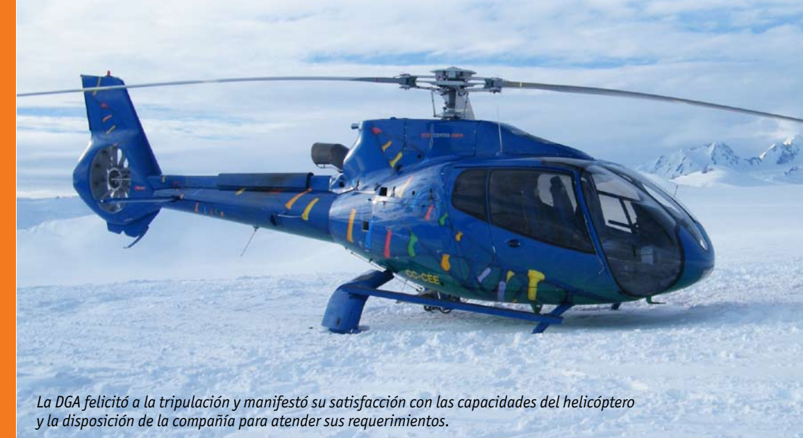
La DGA felicitó a la tripulación y manifestó su satisfacción con las capacidades del helicóptero y la disposición de la compañía para atender sus requerimientos.

Asimismo, considerando el fuerte desarrollo esperado para la región, EcoCopter envió un nuevo helicóptero para satisfacer las necesidades de trabajos aéreos en una serie de nuevos proyectos de investigación, prospecciones y conectividad.