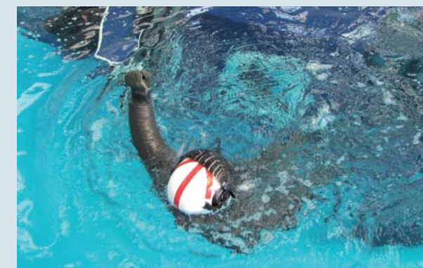
El entrenamiento de Escape de Cabina es exigido en Europa y Estados Unidos para los vuelos sobre agua con pasajeros.

El Gerente de Operaciones de EcoCopter agrega que la capacitación permanente es la clave para mantenernos a la vanguardia de las nuevas tecnologías: “Vamos a continuar enviando a nuestro personal a las siguientes capacitaciones en SMS, y esperamos capacitar a nuestras tripulaciones en un entrenamiento fisiológico en la cámara altimétrica del Departamento MAE de la FACH”.