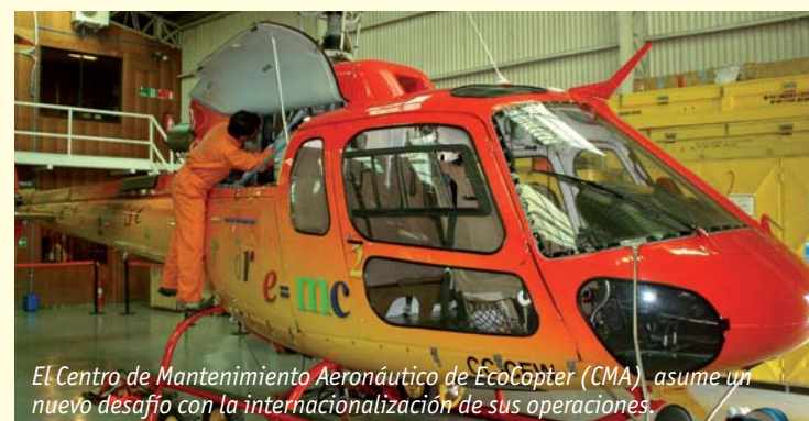
El Centro de Mantenimiento Aeronáutico de EcoCopter (CMA) asume un nuevo desafío con la internacionalización de sus operaciones.

“EcoCopter está arrendando una aeronave con matrícula argentina, para lo cual era necesario cumplir con este requisito. Sin embargo, el alcance de este paso es mucho más amplio, ya que permite a nuestro CMA comercializar los labores de mantenimiento a empresas trasandinas”, explica el Gerente